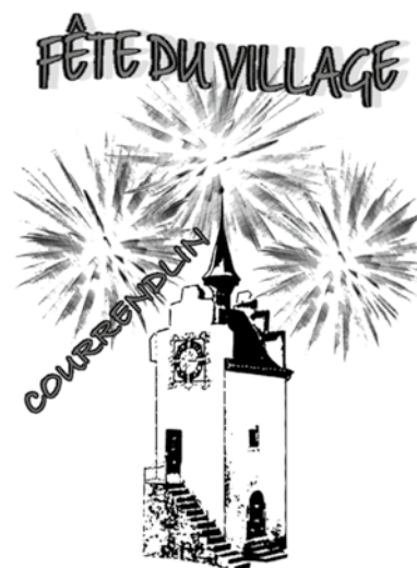
Le Comité de la fête

Nous vous attendons les vendredi 5, samedi 6 et dimanche 7 août 2016!