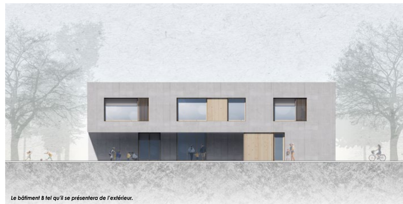
Le bâtiment B tel qu'il se présentera de l'extérieur.