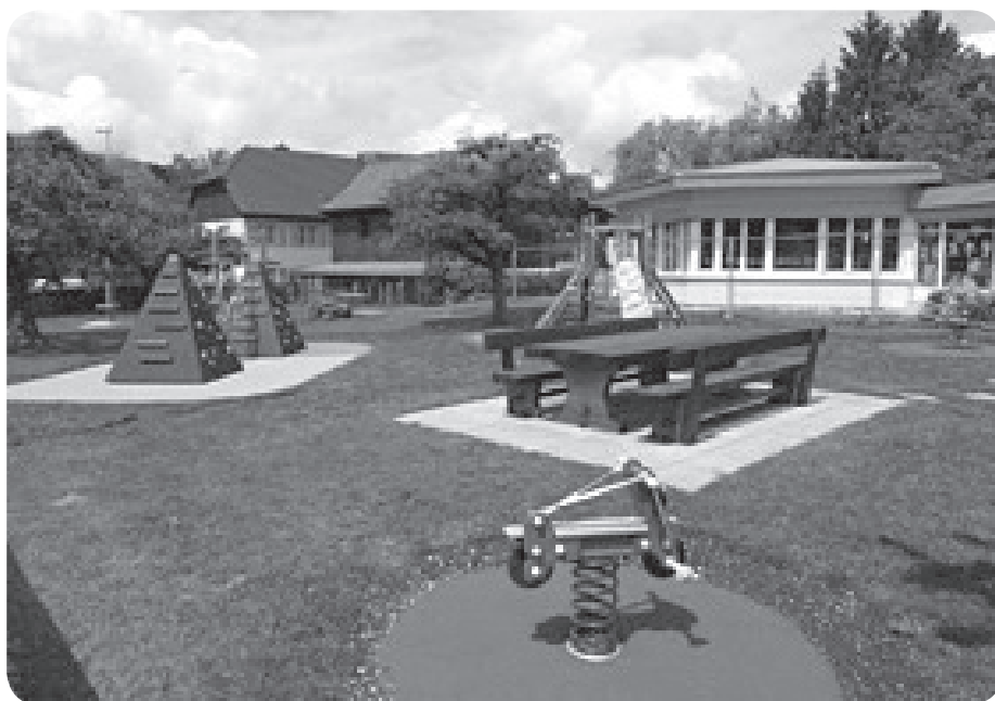
La nouvelle place de jeux de l'école enfantine : un investissement pour les générations futures.

En plus des terrains abordables, les habitants apprécient la vie à Courrendlin, car il y a tout, ... presque tout. Ecoles primaire et secondaire, crèche, résidence pour personnes âgées, commerces et artisanat, sociétés locales et transports publics participent à l'attrait du village. Cependant, toutes ces prestations doivent évoluer, afin de répondre aux attentes de la population.