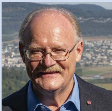
Pierre-André Comte • PS Député

Le 19 octobre, les Jurassiens ont élu leur Parlement pour la législature 2026-2030