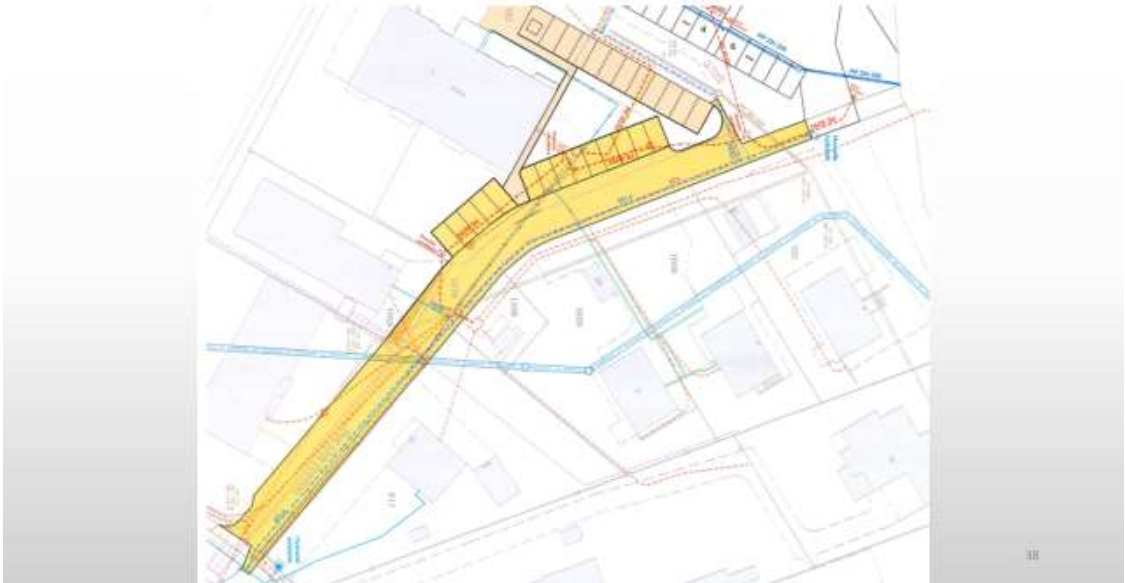
Projet réfection rue Clos Brechon